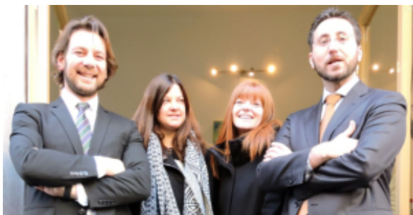
Studio Legale ROSSI & MARTIN